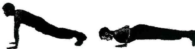
Рис. 8. Сгибание и разгибание рук в упоре лежа

Упор лежа, туловище прямое, согнуть руки до касания грудью пола, разгибая руки, принять положение упор лежа.