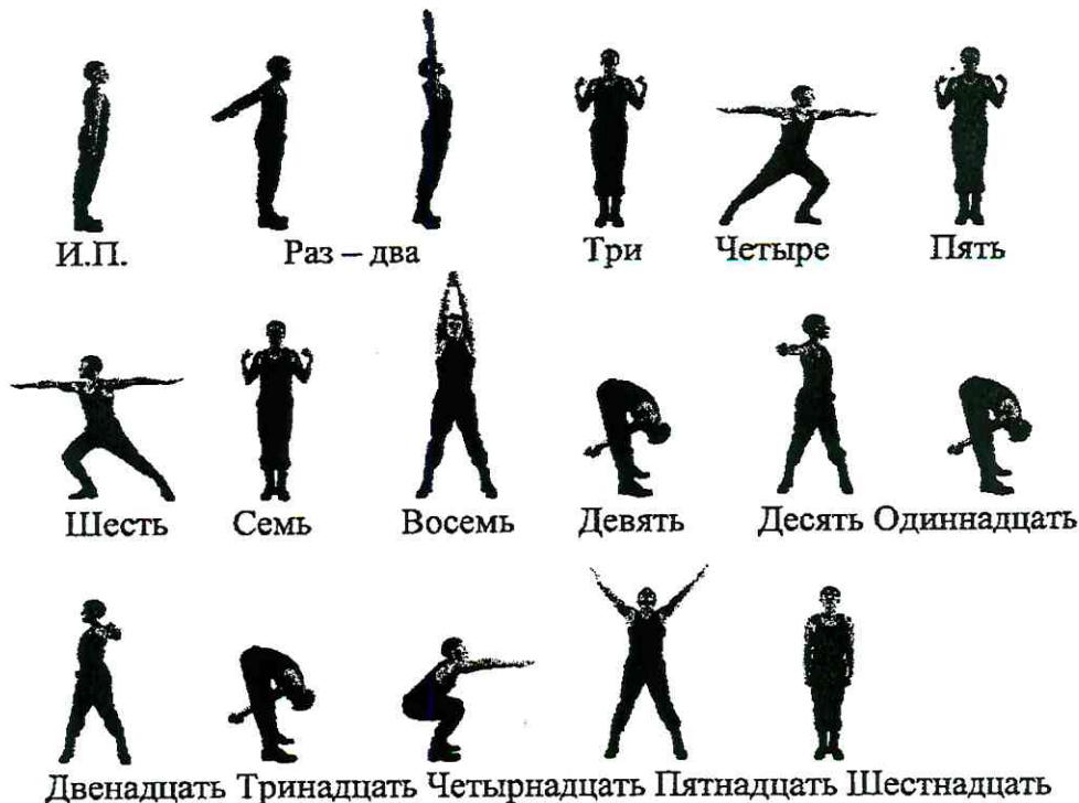
Рис. 2. Комплекс вольных упражнений № 2

"Шестнадцать" - прыжком строевая стойка.