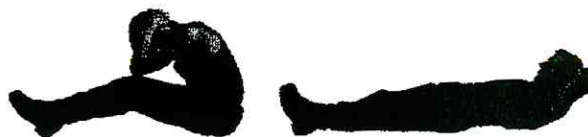
Рис. 7. Наклоны туловища вперед

Разрешается незначительное сгибание ног.