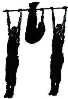
Рис. 4. Поднимание ног к перекладине

Упражнение 5. Подъём переворотом на перекладине (рис. 5).