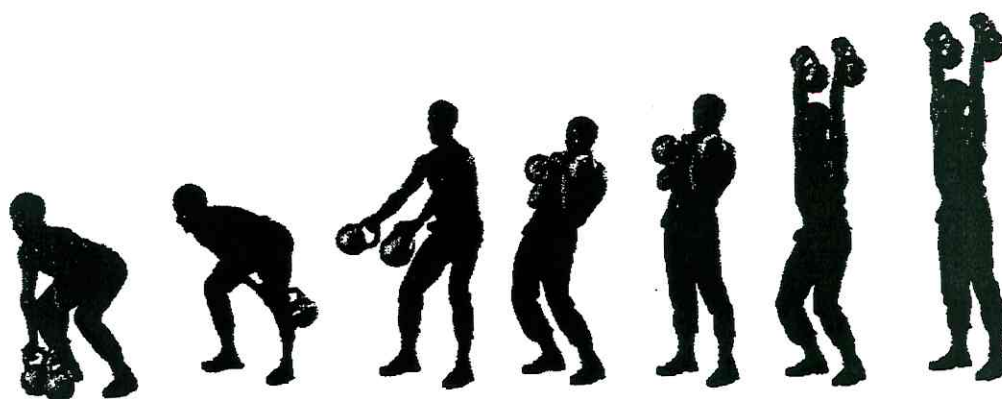
Рис. 10. Толчок двух гирь