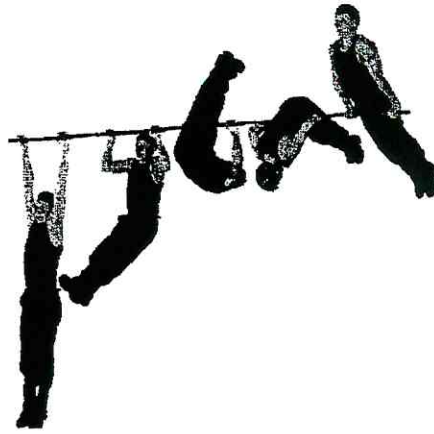
Рис. 5. Подъем переворотом на перекладине