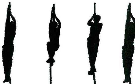
Рис. 9. Лазание по канату

Запрещается спрыгивать с каната выше отметки 2 м от пола.