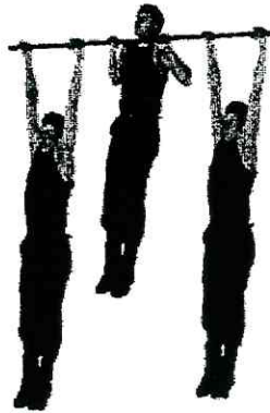
Рис. 3. Подтягивание на перекладине

Запрещается выполнение движений рывком и махом.