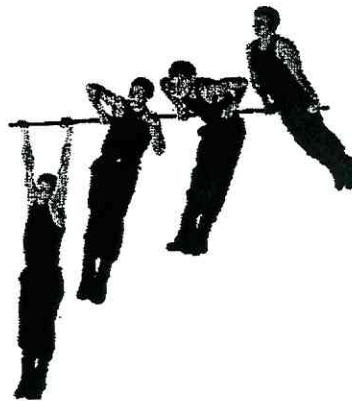
Рис. 6. Подъем силой на перекладине

Запрещается выполнение движений рывком и махом.